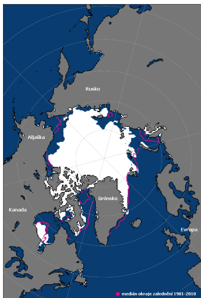
celková rozloha = 7,6 milionu kilometrů čtverečních